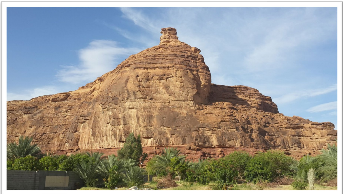
al-'Ulā, l'Antique Dedān (Arabie Saoudite)